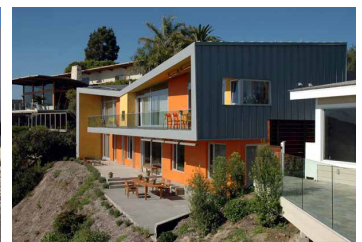
Version moderne d'un enduit à la chaux | www.naturawalls.com

Les enduits à la chaux permettent de récupérer les irrégularités du mur. Ils sont respirants et étanches à l'eau de pluie. L'enduit de chaux seul n'a par contre pas de propriétés d'isolation thermique intéressantes. Au niveau environnemental, un enduit de chaux implique deux fois moins d'énergie grise qu'un enduit au ciment et sept fois moins qu'un enduit synthétique.