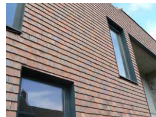
Façade de tuiles en terre cuite

Les tuiles en terre cuite peuvent également être utilisées comme revêtement mural. La tuile demande néanmoins un support plus résistant que l'ardoise, vu son poids plus élevé.