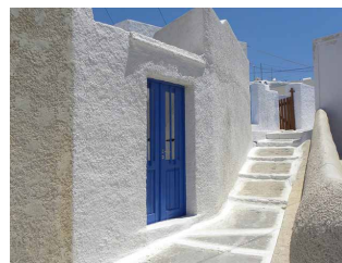
Version traditionnelle d'un enduit à la chaux

Il est possible de poser sur les façades des enduits de finition. Les enduits colorés à la chaux sont connus depuis longtemps. Utilisés traditionnellement pour protéger des constructions en pierre friable, ils se déclinent dans une grande diversité de teintes comme en témoignent les façades colorées de villages entiers en Italie.