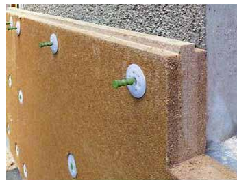
Panneau isolant en fibre de bois prêt à enduire | www.cest-tout-vert.com

Les enduits à la chaux permettent de récupérer les irrégularités du mur. Ils sont respirants et étanches à l'eau de pluie. L'enduit de chaux seul n'a par contre pas de propriétés d'isolation thermique intéressantes. Au niveau environnemental, un enduit de chaux implique deux fois moins d'énergie grise qu'un enduit au ciment et sept fois moins qu'un enduit synthétique.