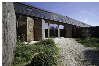
Revêtement de façade en bois

Le bois offre aujourd'hui une diversité étonnante de solutions, allant des traditionnels bardeaux de cèdre aux panneaux de bois, en passant par toutes les formes de bardage. Le bois permet ainsi de donner une allure traditionnelle, comme moderne au bâti. En rénovation, on profitera idéalement de la pose d'un bardage en bois pour réaliser une isolation par l'extérieur. L'isolant peut être fixé mécaniquement au mur existant. Puis un pare-pluie est installé. Un double lattage sur lequel on fixe le bardage permet ensuite de laisser une lame d'air entre le pare-pluie et le bardage. La lame d'air favorise le bon séchage du bardage et donc la conservation du bois.