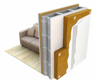
Application d'un enduit sur un panneau isolant

Le secteur des enduits à la chaux s'est largement adapté aux nouveaux types de construction et aux nouvelles exigences en matière d'isolation, notamment grâce au développement de panneaux d'isolation prêts à enduire et l'offre d'enduits pré-formulés adaptés à une grande diversité de supports. Ces panneaux isolants sont collés ou fixés mécaniquement au mur existant. Ensuite, un enduit d'accroche est appliqué, dans lequel un treillis d'armature est noyé (p.ex un filet de lin). La finition du mur est constituée d'une couche de fond et une couche de finition.