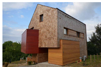
Façade en bardeaux de bois © Atelier Chora & WattsUp Engineering