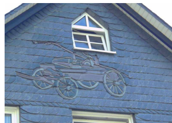
Façade en ardoises naturelles Stefan Didam

Les ardoises naturelles bénéficient d'une durée de vie très longue, mais sont chères à l'achat. Elles sont assemblées avec une superposition en « écailles de poisson », garantissant une étanchéité totale à la pluie et au vent. Les ardoises en fibrociment sont couramment utilisées comme alternative pour les ardoises naturelles. Beaucoup plus abordables, elles permettent également une grande variété de formes, dimensions et couleurs. Leur durée de vie est par contre beaucoup plus réduite (20 ans contre 100 ans pour les ardoises naturelles) et les possibilités de recyclage limitées à cause de la présence de résines et de fibres de synthèse.