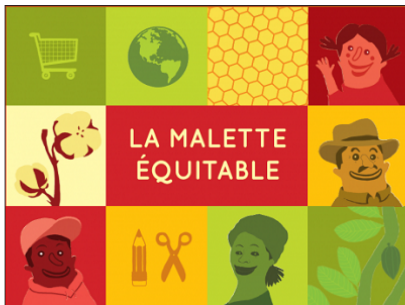
La malette équitable

Dès le plus jeune âge on peut sensibiliser les enfants au commerce équitable. En tant que prof, stagiaire, formateur ou équipe pédagogique, on peut s'appuyer sur des outils d'animation, des jeux, dossiers pédagogiques, etc.