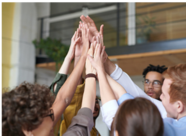
5 bonnes raisons d'investir dans une coopérative citoyenne

Éolienne citoyenne, supermarché coopératif, banque éthique... Les coopératives citoyennes changent le monde. Voici 5 bonnes raisons de devenir coopérateur