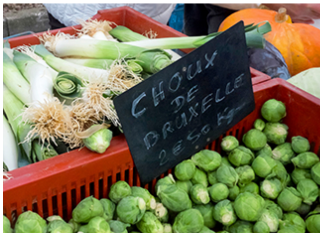
Pour le climat, on mange local, de saison et bio

Manger bio, local et de saison permet d'économiser 80 kg de CO 2 par personne et par an. Un bon réflexe pour préserver le climat et mieux se nourrir.