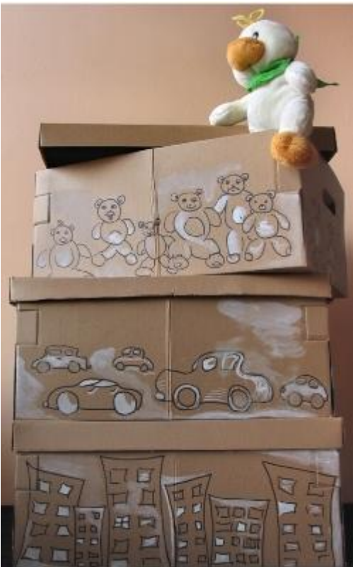
Étagère murale en tiroirs , mobiles , caisse à jouet de récup et en carton.