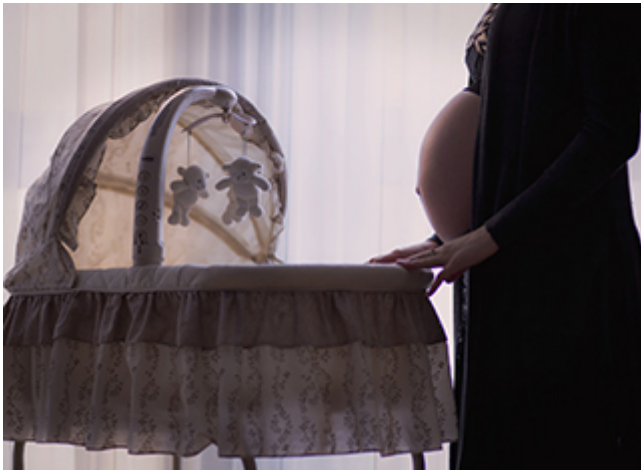
Aménager la chambre de bébé au naturel

On aménage la chambre de bébé au naturel avec des meubles, un lit bébé et de la déco écologiques. Nos conseils pour bien choisir et les trouver pas cher.