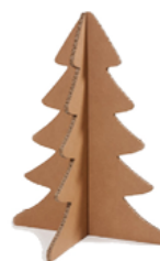
Sapin fait maison en récup'