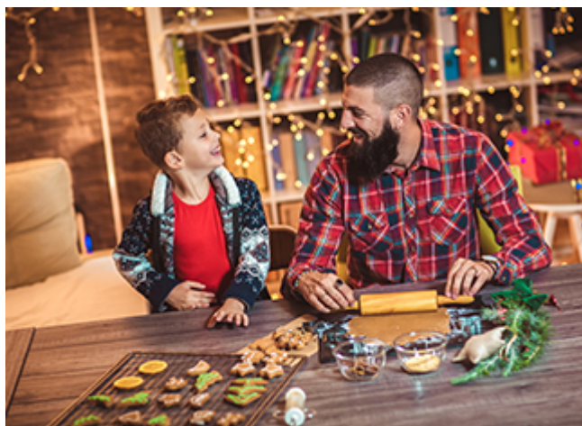
Astuces pour un Noël durable et abordable

Préparer un Noël festif, gourmand tout en étant respectueux de la planète et moins cher, c'est possible. Conseils et mode d'emploi.