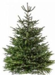
Sapin bio belge, coupé soi-même