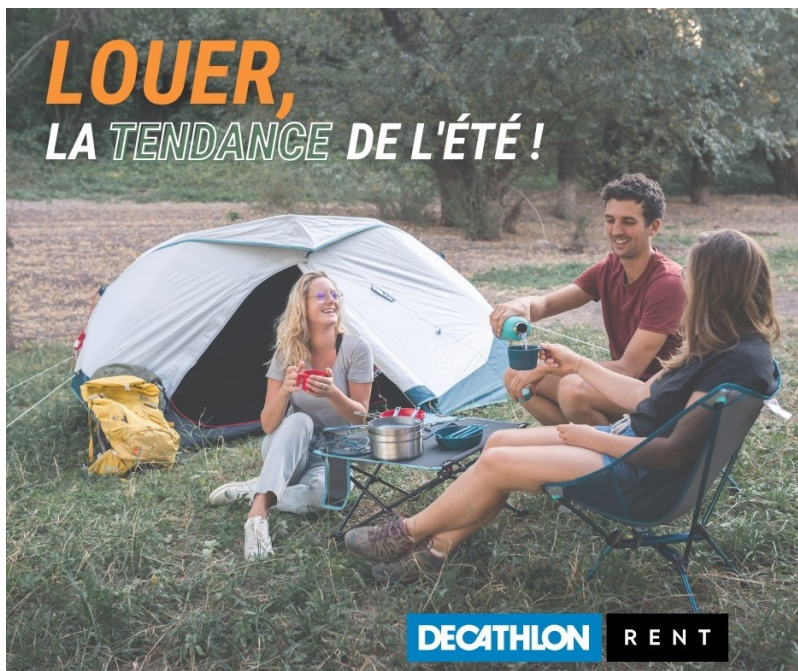
Location de matériel de camping chez Decathlon