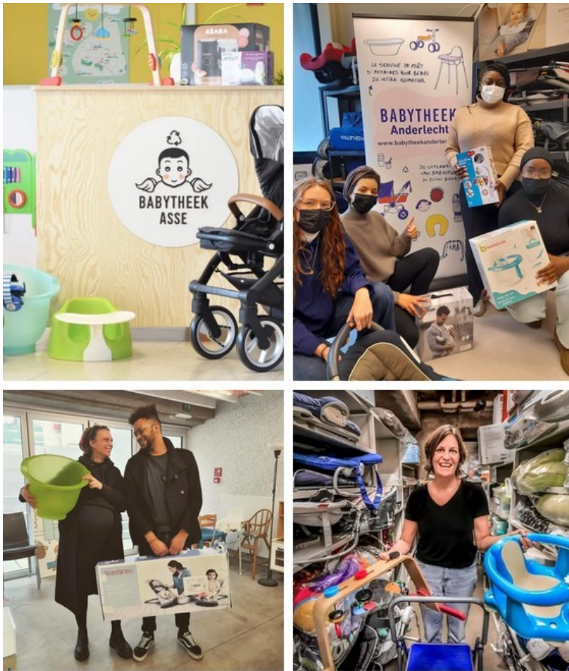
Location de matériel de puériculture à la Babytheek