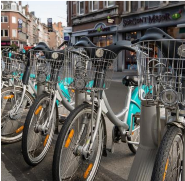
Location de vélo chez Li Bia vélo