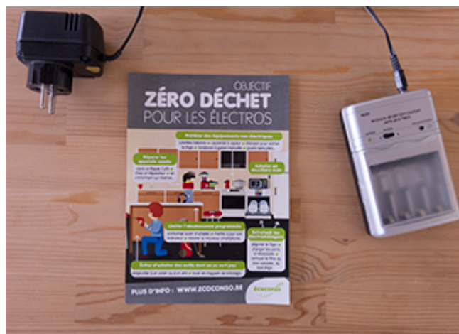
Objectif zéro déchet pour les électros

On peut être connecté et équipé et réduire ses déchets. Voici des conseils, astuces et idées pratiques pour des électros zéro déchet.