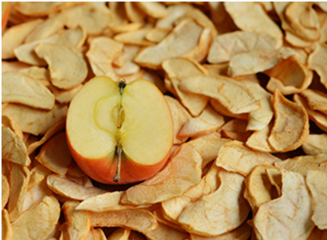
Sécher des pommes pour les conserver

On peut faire sécher ses fruits et ses légumes au soleil, au four ou au déshydrateur, pour les conserver tout l'hiver.