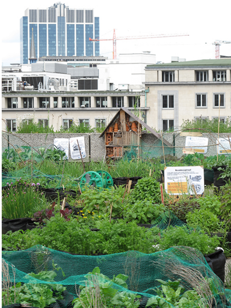
Le potager toit de la KBR, Bruxelles

En Wallonie, la « Ceinture aliment-terre liégeoise » s'est engagée dans la transformation du système alimentaire régional en favorisant l'accès du plus grand nombre à une alimentation locale de qualité. S'inspirant des ceintures vivrières , elle rassemble de nombreux acteurs locaux du secteur, comme des fermiers, des distributeurs, des restaurateurs, des consommateurs ainsi que des associations et acteurs du mouvement des villes en transition. Cette initiative a donné des idées et des ceintures alimentaires se développent à Namur et à Charleroi . Le projet VERDIR de l'Université de Liège quant à lui cherche à réhabiliter les friches industrielles de Wallonie en sites d'agriculture biologique.