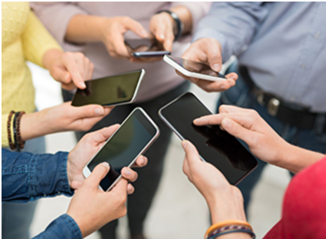
Comment acheter un smartphone durable ?

Acheter un smartphone durable, est-ce possible ? Réparabilité, mises à jour, labels... Voici quoi vérifier pour choisir un téléphone plus écologique.