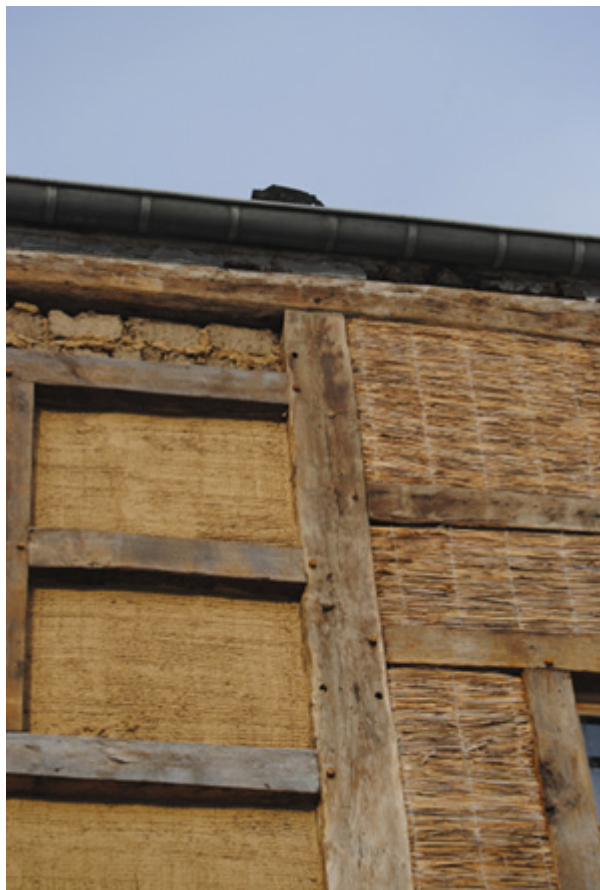
Façade en restauration en colombage et torchis.