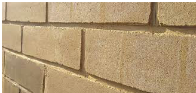
Bloc de terre crue « Argio », Belgique.

Certains blocs de terre comprimée permettent aussi de les utiliser pour la réalisation de murs porteurs intérieurs ou extérieurs. En murs extérieurs, ils sont utilement combinés avec la pose d'une isolation extérieure.