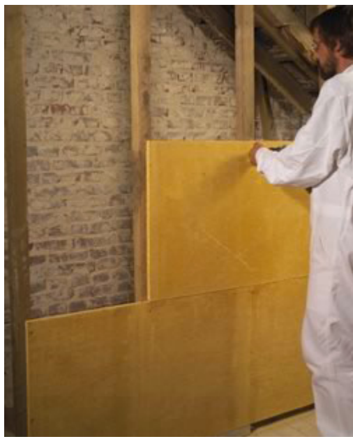
Panneaux d'argile Claytec.

Variantes. Les enduits de terre peuvent aussi être projetés à la machine. Il existe également des panneaux d'argile pour permettre une construction « sèche ».