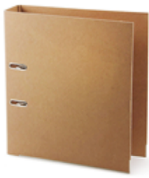
Carton recyclé ou labellisé 2,20 €