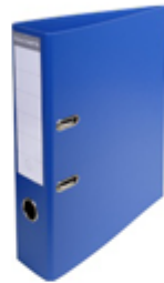
Carton plastifié 4,73 €