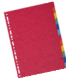
Simple carton 1,83 €