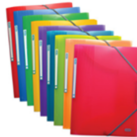
Plastique 3,55 €