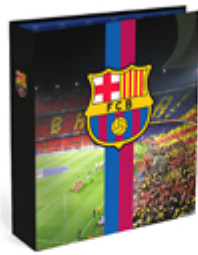
Décor « marketing » 4,09 €