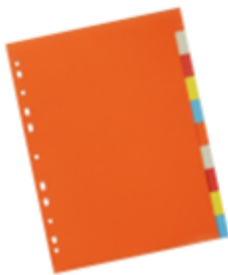
Carton recyclé ou labellisé 1,26 €