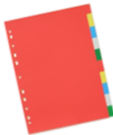
Plastique 1,31 €