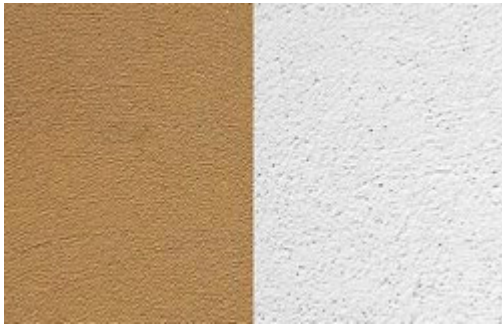
Enduit de finition contenant des fibres de lin.

On peut utiliser un enduit en terre crue avec un chauffage par les murs. Les conduites d'eau chaudes sont alors noyées dans l'enduit.