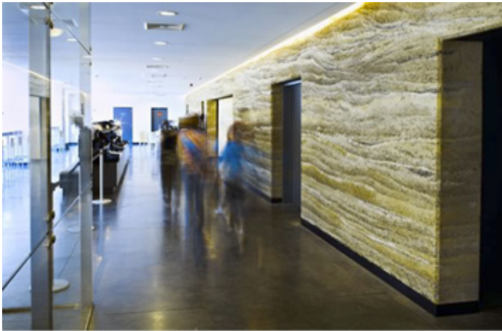
Mur en pisé au Musée Source O Rama à Chaudfontaine, Belgique.

Selon la technique du coffrage en place ou pisé , on coule et on tasse une masse d'argile dans un coffrage qui remonte au fur et à mesure du séchage des couches successives. Le mur final peut être épais, massif et sans joints. Une variante consiste à ajouter de la paille hachée dans le mélange. C'est une technique de construction ancienne. Aujourd'hui, on l'utilise lorsque l'on cherche à augmenter l'inertie thermique de la maison, grâce à la densité élevée de la terre. La variation dans les teintes de la terre utilisée pour chaque couche permet toute sorte de jeux esthétiques.