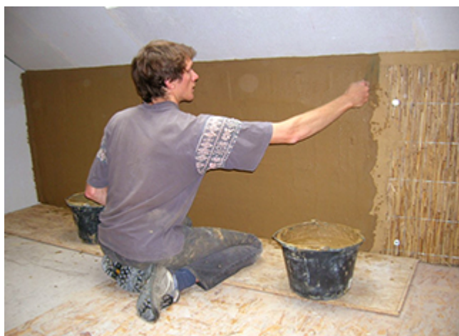
Plafonnage à l'argile

L'argile est une précieuse alliée pour la construction ou la rénovation écologique. On peut l'employer du gros œuvre aux finitions, pour ses briques, comme enduit, en tant qu'isolant ou comme peinture.