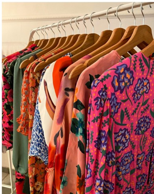
Exemple de vêtements de chez Seoir