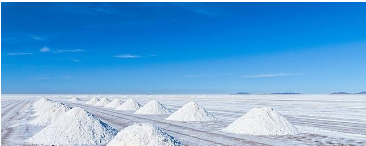
Salar de Uyuni en Bolivie