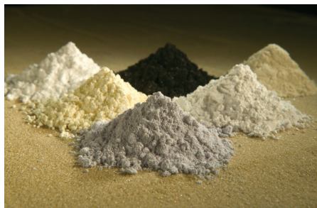
Terres rares.